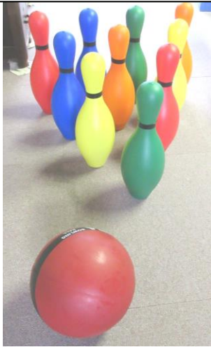
カラーボウリングゲーム