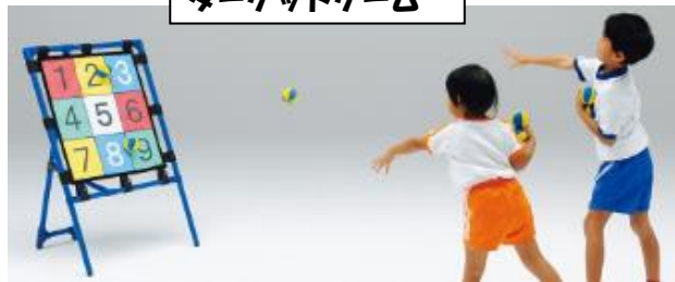
ターゲットゲーム