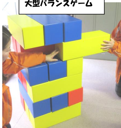
大型バランスゲーム